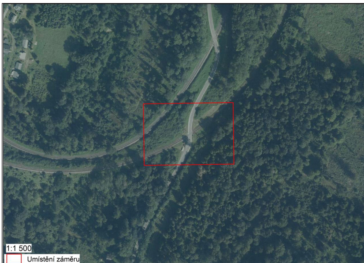
Obr. 2: Umístění záměru orotofoto (zdroj: ČUZK)